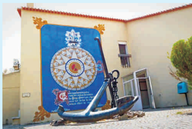
Centro de Apoio Social do Alfeite Rua José Carlos de Melo, 2810-239 Almada | 212 736 360 | easalfeite@iasfa.pt