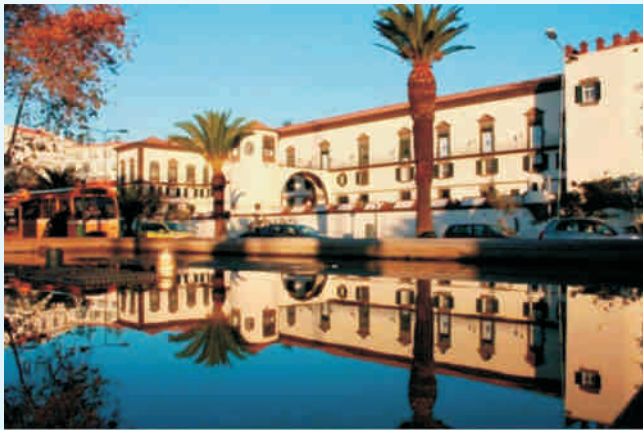
Centro de Apoio Social do Funchal Palácio de São Lourenço, Av. Zarco, 9000-059 Funchal | 291-242 047 | casfunchal@iasfa.pt

Este facto materializa um contributo financeiro com o qual, os Militares auxiliam organizada e desinteressadamente os seus camaradas de armas ou os seus familiares dependentes em situação de carência ou necessitados de um apoio especial e continuado de acordo com a sua situação social, física ou anímica e que se concretiza de facto e fundamentalmente no APOIO a IDOSOS.