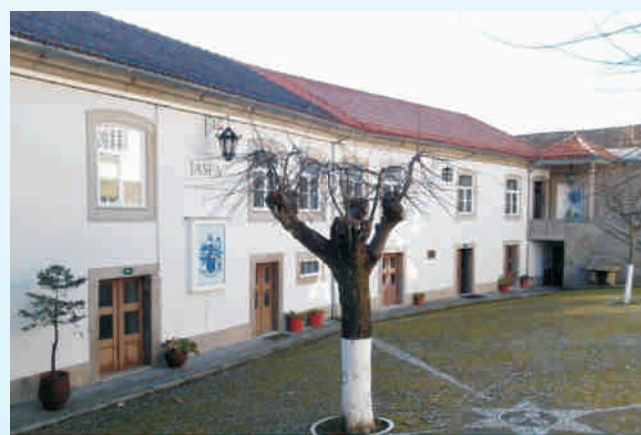
Centro de Apoio Social de Viseu Rua Direita, 3504-503 Viseu | 232 429 358 | eusviseu@iasfa.pt

fevereiro de 2019 na audição perante a Comissão de Defesa da Assembleia da República, transmitidas ao público no canal aberto da Assembleia da República, nos termos supra referidos, bem sabendo que as mesmas não correspondem à verdade e são ofensivas da credibilidade e prestígio da instituição IASFA preenche objetiva e subjetivamente os elementos do tipo de crime previsto e punido pelo art.º 187º do Código Penal.”