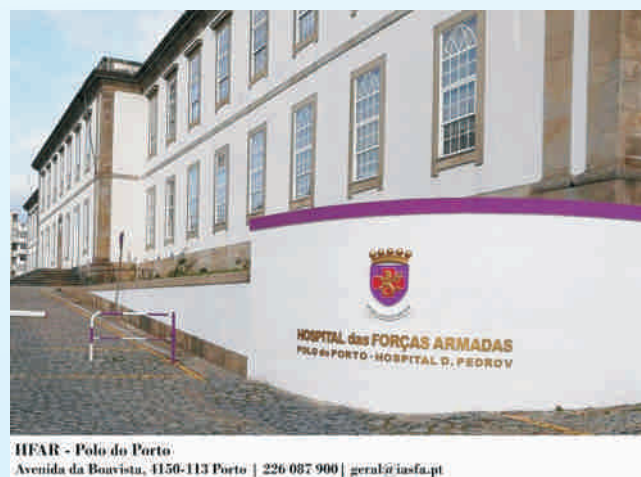
HEAR - Polo do Porto Avenida da Boavista, 4150-113 Porto | 226 087 900 | geral@iasfa.pt

Existe uma única alternativa à rejeição deste aditamento que é a migração da ADM do IASFA.