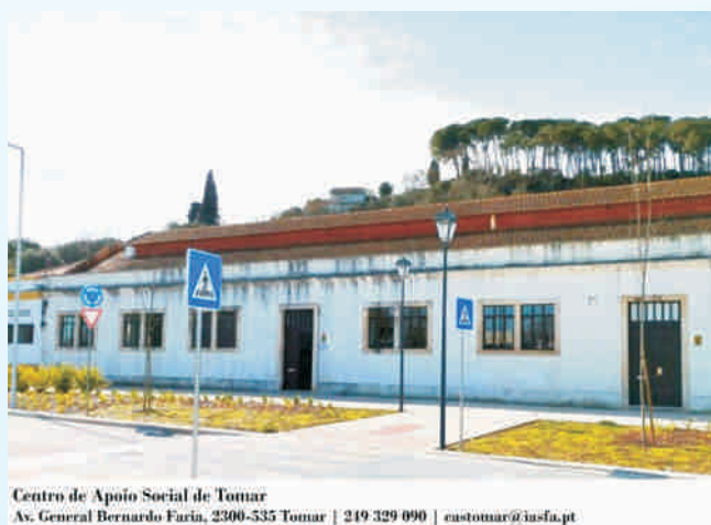
Centro de Apoio Social de Tomar Av. General Bernardo Faria, 2300-535 Tomar | 219 329 090 | eastomar@iasfa.pt

Também não parece curial a alienação do património do IASFA, ex-CPFA e ex-SSFA para liquidação da dívida da ADM, que constituiu um “presente envenenado” para o IASFA.”