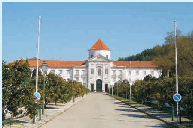
Centro de Apoio Social de Runa Rua Princesa Maria Francisca Benedita 2565-752 Runa | 261 330 070 | casruna@iasfa.pt

O IASFA incorporou ainda nos seus equipamentos sociais o Lar de Veteranos Militares de Runa que acolhe idosos, o Complexo Social de Oeiras que acolhe mais de 400 idosos e o Centro Médico e Educativo do Alfeite, que passaram a designar-se de Centros de Apoio Social.