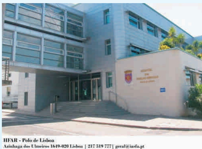
HEAR - Polo de Lisboa Azinhaga dos Ulmeiros 1649-020 Lisboa | 217 519 777 | geral@iasfa.pt

E a dívida da ADM aos privados começou em 2020 a ser sanada através de um Memorando de Entendimento entre o IASFA, o Ministério da Finanças e o Ministério da Defesa Nacional.