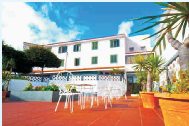
Centro de Apoio Social de Porto Santo Rua Dr. Nuno Silvestre Teixeira, 9400-162 Porto Santo | 291 982 277 | cereposa@iasfa.pt

Ainda porque no Regime Jurídico da ADM expresso no artigo 16 da sua lei orgânica, Decreto-Lei n.º 193/2012 de 23 de agosto está plasmado; “ Responsabilidade pelo pagamento O pagamento da prestação de cuidados de saúde previstos em diploma próprio, na parte excedente ao pagamento devido pelo beneficiário, é da responsabilidade exclusiva do Estado Português. ”