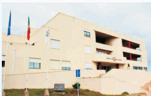
Centro de Apoio Social de Oeiras Rua D. Duarte, 2, 2780-064 Oeiras | 211 461 200 | easoeiras@iasfa.pt

No “Plano Estratégico para o Apoio Social 2015/20” do IASFA constam duas grandes medidas no que respeita à valência razão de ser do IASFA, o Apoio a Idosos e cita-se “Estruturas Residenciais para Idosos”.