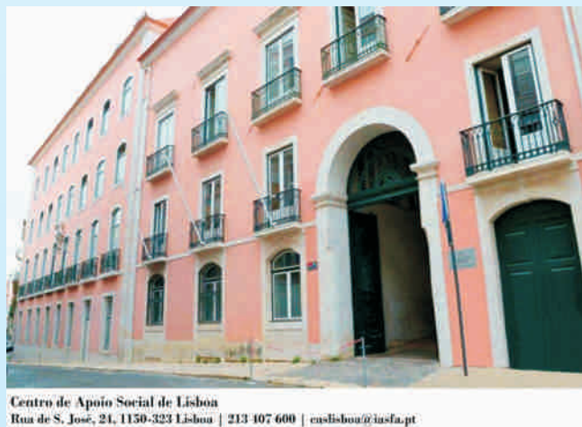
Centro de Apoio Social de Lisboa Rua de S. José, 21, 1150-323 Lisboa | 213 407 600 | caslisboa@iasfa.pt

Numa atitude que foi considerada um “ato de bondade” criou uma “discriminação positiva” para este universo de militares. Isentou de quotização para o subsistema ADM desde que a deficiência pela TNI seja no mínimo de 30%, quando os demais servidores de estado beneficiários do subsistema ADSE tem essa compensação quando portadores de deficiência no mínimo de 60%.