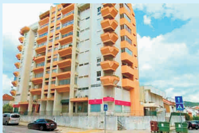
Centro de Apoio Social de Coimbra Rua Pedro Álvares Cabral, 90, 3030-069 Coimbra | 239 713 232 | eascoimbra@iasfa.pt

O IASFA é uma instituição de solidariedade social, de natureza e de espírito mutualista, para a qual todos os Militares dos Quadros Permanentes no ativo, reserva e reforma descontam, em 2006 o Ministério da Defesa determinou a suspensão, uma parte dos seus vencimentos.