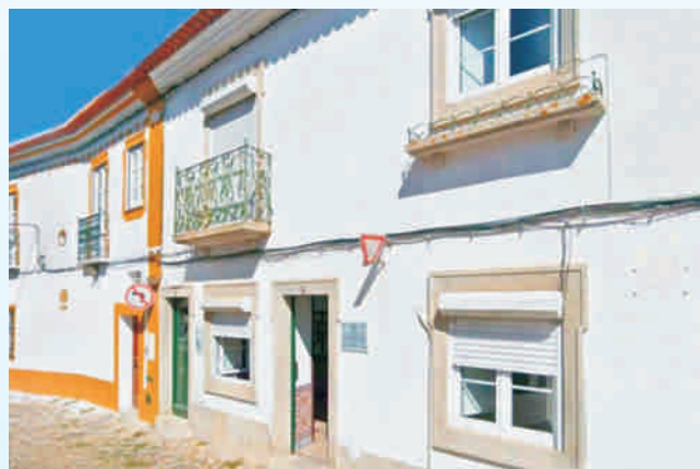
Centro de Apoio Social de Évora Rua Mestre Resende, 3, 7000-611 Évora | 266 708 984 | casevora@iasfa.pt

bem-estar do idoso, assim como na sustentabilidade financeira destas estruturas”